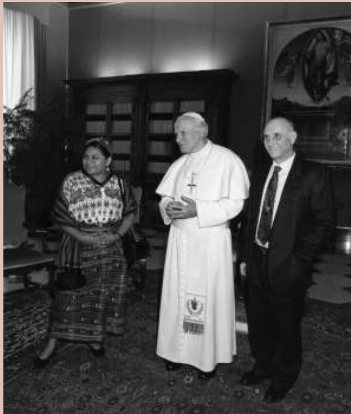
Rigoberta Menchù, premio Nobel per la pace 1992, in udienza dal Papa, con Giovanni Bianchi

L'incontro cordiale e festoso con Giovanni Paolo II suggella la nuova forte comunione ecclesiale delle Acli